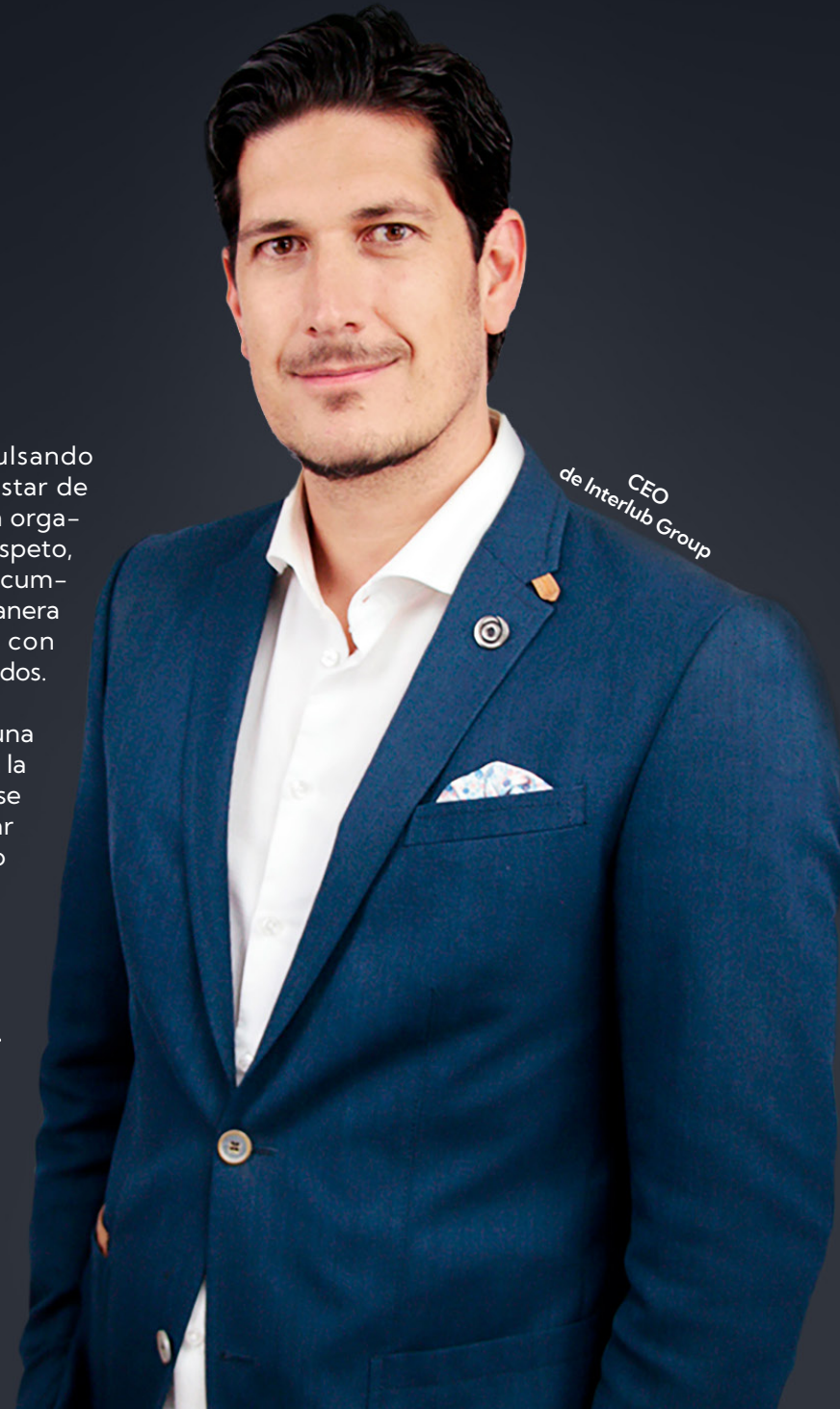
CEO de Interlub Group